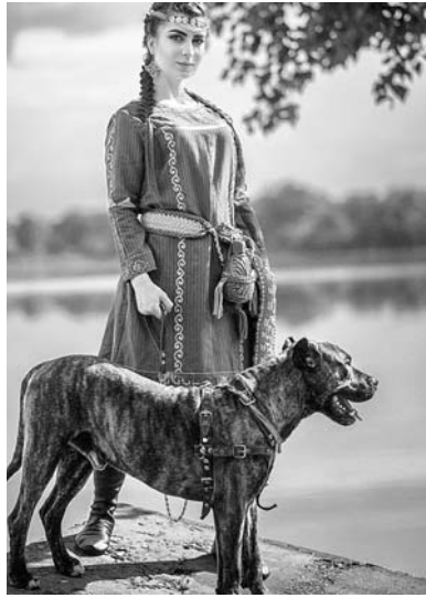
они должны были рассказать о том месте, где проходили съемки, например, о водопаде

— Главная цель конкурса — дать каждой участнице возможность окунуться в историю своих предков. Помимо этого,